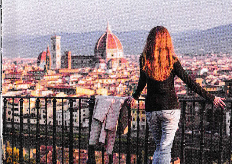
Priveliște de sus asupra orașului Florența

Verificați încă un obiectiv turistic care va fi în curând dezvăluit în Complexul Santa Maria Novella: Muzeul Național al Limbii Italiene (MUNDI) care prezintă istoria limbii de la originile antice și evoluția acesteia în epoca digitală, cu o deosebită onoare pentru inegalabilii florentini precum Dante și Boccaccio.