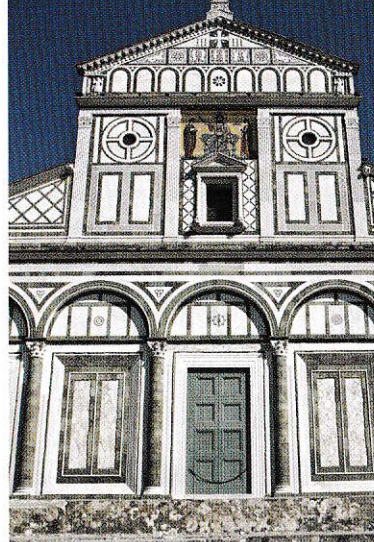
Fațada bisericii San Miniato datează din sec. XI

La momentul respectiv, Florența arăta foarte diferit de orașul de astăzi. Familiile bogate ale comercianților își fortificau casele cu turnuri pătrate din piatră, adesea mai înalte de 70 de metri, care serveau drept refugii impenetrabile în timpul conflictelor recurente care divizau comunitatea. Până la finalul secolului XII, orașul număra peste 150 de astfel de turnuri. Doar câteva dintre ele au supraviețuit, însă vă puteți face o idee despre cum arăta orașul în „tinerete” vizitând orașelul toscan San Gimignano, situat pe o colină (pagina 82).